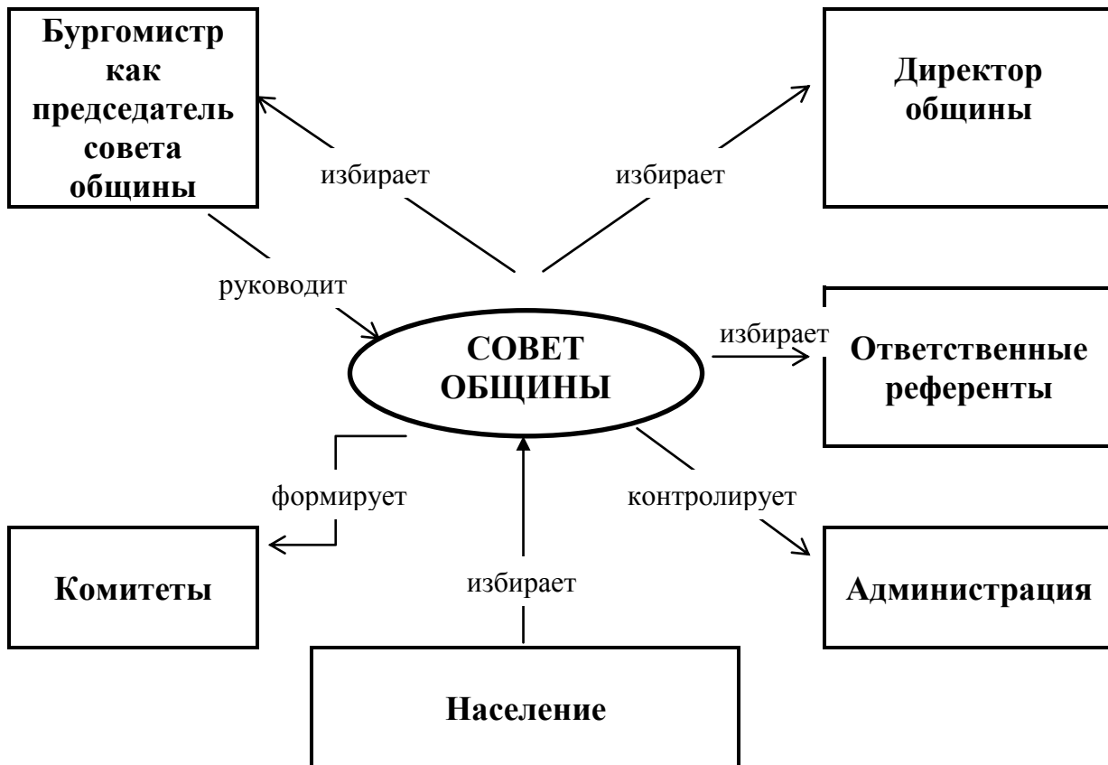
Схема 2. Южногерманская модель